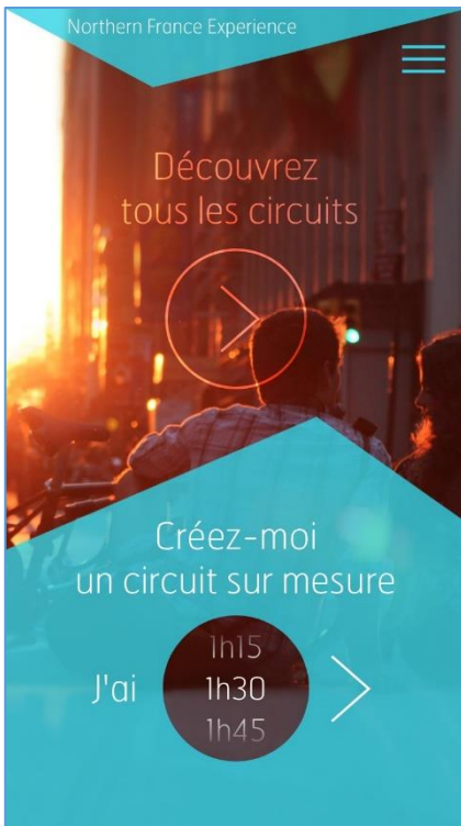
Page d'accueil de l'application