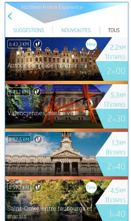
Liste des différents parcours proposés dans l'application