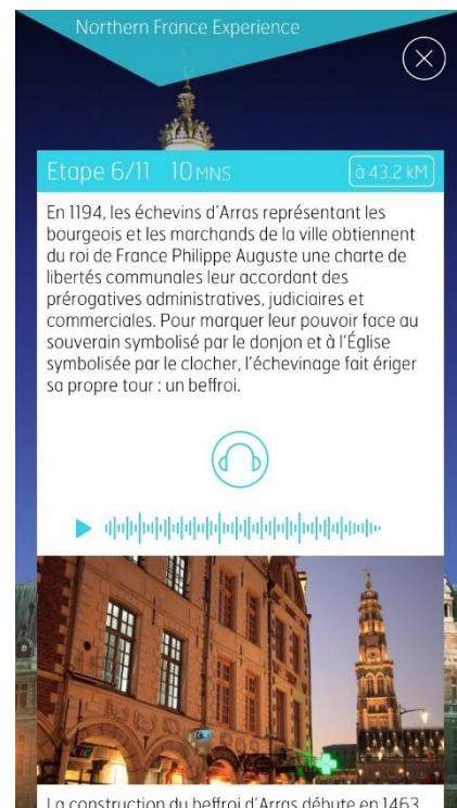
Exemple de contenu